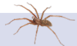
Hormigas y Arañas ( Bacillus turingiensis ) y algunos hongos