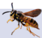
Avispas ( Spalangia , Muscidifurax , Pachycrepideus )

Ejemplos de control biológico de moscas son: