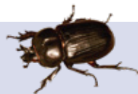
Escarabajos Carcinops y coquito ( Alphitobius diaperinus )